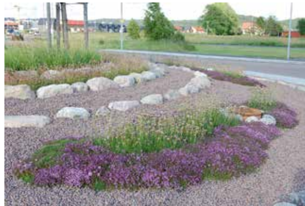
Rondell i Kungälv med bl a strandtrift och timjan som blir en bra kombination i trafikmiljö.

Vi odlar plantor och vegetation av svenskt ursprung och anpassad till vårt klimat. En fullständig förteckning över våra plantor som är extra lämpade för trafikmiljöer finns i avsnittet "Örtplugg för mark".