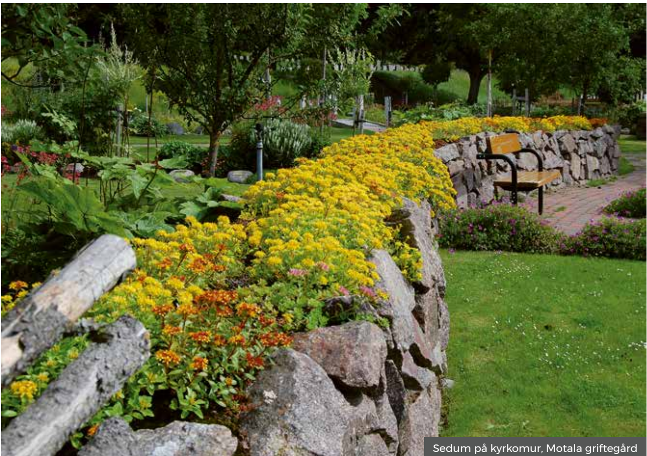
Sedum på kyrkomur, Motala griftegård