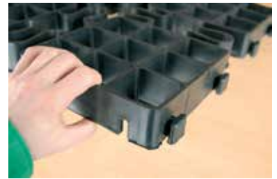
Pelleplattorna sammanfogas med hakar respektive spår i plattans sidor.

Underlaget bygges opp og dimensioneres for den belastning som forventas på ytan. Pelleplattan har hakar på två sidor av plattan og spår på de andra två sidorna. Dessa används för att haka ihop plattorna med varandra. Plattorna hakas i varandra genom att trampa till med klacken eller genom att slå lätt med exempelvis en gummiklubba. Vid behov av tillpassning kan Pelleplattan enkelt ka-pas t ex av en såg eller klippas med en kraftig grensax. Pelleplattan läggs i ett ruttmönster över den väl förberedda ytan. Det är viktigt att Pelleplattan kommer att ligga ca 10 mm under angränsande beläggning typ asfalt eller marksten, annars är risken stor att Pelleplattan kan slitas upp vid t.ex. snöröjning. Justera därför nivåerna väl innan utläggningen av plattorna startar.